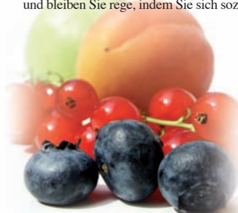
Vitamine helfen vorbeugen

engagieren und Ihre grauen Zellen in Schuss halten. Vorbeugung ist zwar kein Patentrezept, um gesund zu bleiben, aber doch der beste Weg dorthin.